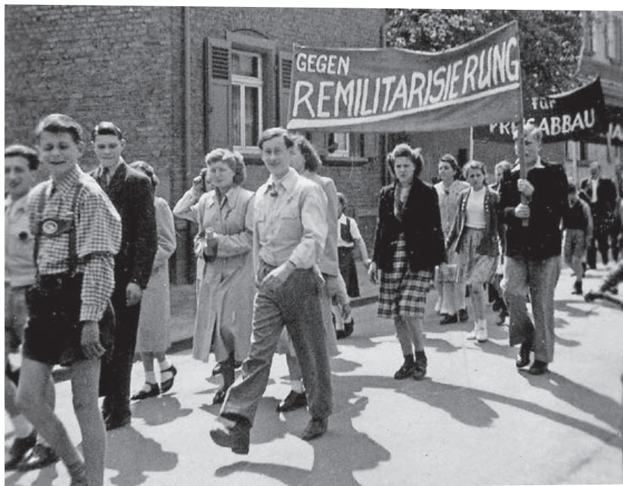
Auch in unserer Stadt gab es damals Demonstrationen gegen eine neue Wehrpflicht.