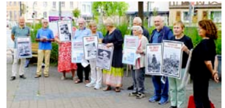
Kundgebung der Antikriegs-Initiative auf dem Mörfelder Rathausplatz

Wir sind ihr und Aladár zu unermesslichem Dank verpflichtet und werden sie niemals vergessen. Zum 40. Jahrestag ihres Todes haben wir diesen Dank durch eine Kranzniederlegung an ihrer Ruhestätte in Budapest zum Ausdruck gebracht.