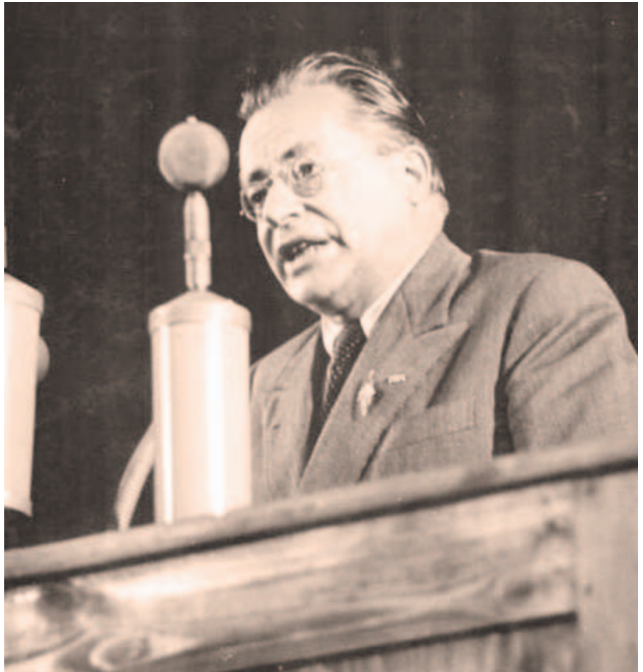
Vor 75 Jahren: Palmiro Togliatti, Generalsekretär der KPI, spricht im Juli 1950 in der Berliner Werner-Seelenbinder-Halle auf dem III. Parteitag der Sozialistischen Einheitspartei.

„Innerhalb jedes Landes sind die Folgen der Krise und die Methoden, derer sich die herrschenden Klassen bedienen, um einen Ausweg aus der Krise zu finden und die Kosten der Krise auf die Schultern der Werktätigen abzuwälzen, so schwerwiegend, dass sie eine weitere Verschärfung der Angriffslust der imperialistischen Bourgeoisie und eine immer große-