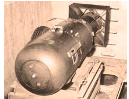
Die erste Atombombe auf dem US-Stützpunkt Tinian vor der Verladung in den B-29-Bomber Enola Gay

Am 6. August 1945 warfen die USA die erste Atombombe auf Hiroshima ab. Am 9. August fiel die zweite auf Nagasaki.