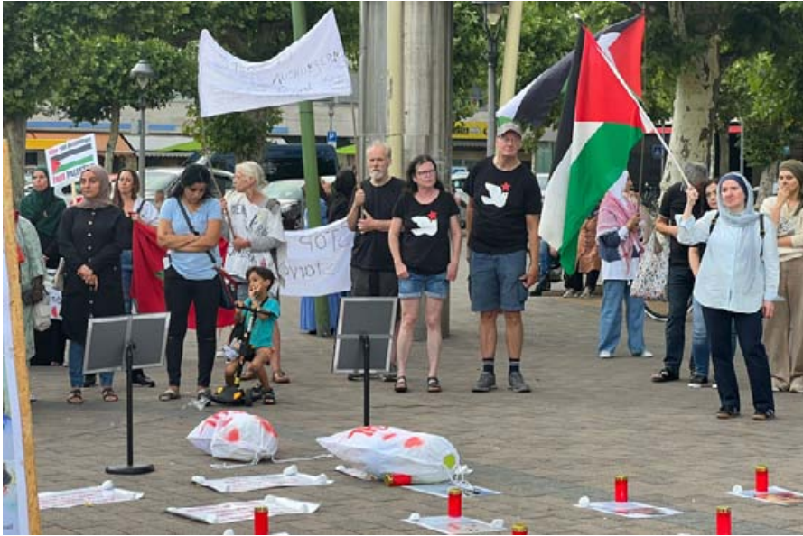
Kundgebung des Bündnisses Palästina Groß-Gerau am 25. Juli auf dem Marktplatz.

Dieter Hallervordens Video „Gaza Gaza“, zu dem Diether Dehm die Lyrik lieferte, hat Aufsehen erregt – Ende April empörte sich der deutsche Blätterwald. „Und das soll kein Völkermord sein?“ – das darf nicht öffentlich gefragt werden. Wer es dennoch wagt, wird wie Hallervorden als „Antisemit“ angegriffen. Tausende Kommentare unter dem YouTube-Video zeugen davon, dass der populäre Theatermann vielen Menschen eine Stimme verlieh, die sich nicht trauen, ihre Meinung zu sagen.