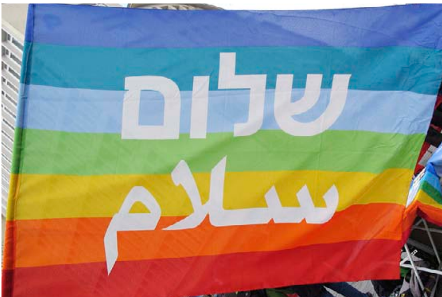
Der Wunsch nach Frieden, auf hebräisch („Shalom“) und arabisch („Salam“).

Sie wollen Frieden statt Kriegstüchtigkeit, soziale Sicherheit statt massenhafter Aufrüstung. Auch in unserem Kreis regt sich der Widerstand: In Groß-Gerau forderten die Unterzeichner des Groß-Gerauer Appells „Stoppt das Töten in Gaza“ und veranstalteten am 23. Juni eine Kundgebung mit 250 Teilnehmern. Ein Bündnis Palästina Groß-Gerau hat sich gegründet und verlieh dieser Forderung in einer weiteren Kundgebung am 25. Juli 2025 Nachdruck. Auch in Rüsselsheim fand am 14. Juli 2025 eine Kundgebung statt.