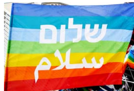
Die Friedensfahne in Israel und Gaza