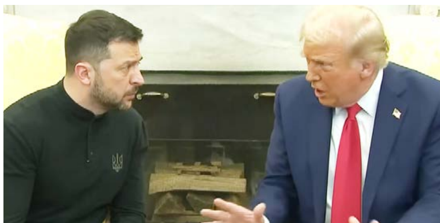
Trump + Selenskyj: Lautstark uneinig

Gekürzt und ergänzt aus: UNSERE ZEIT, Sozialistische Wochenzeitung, Zeitung der DKP