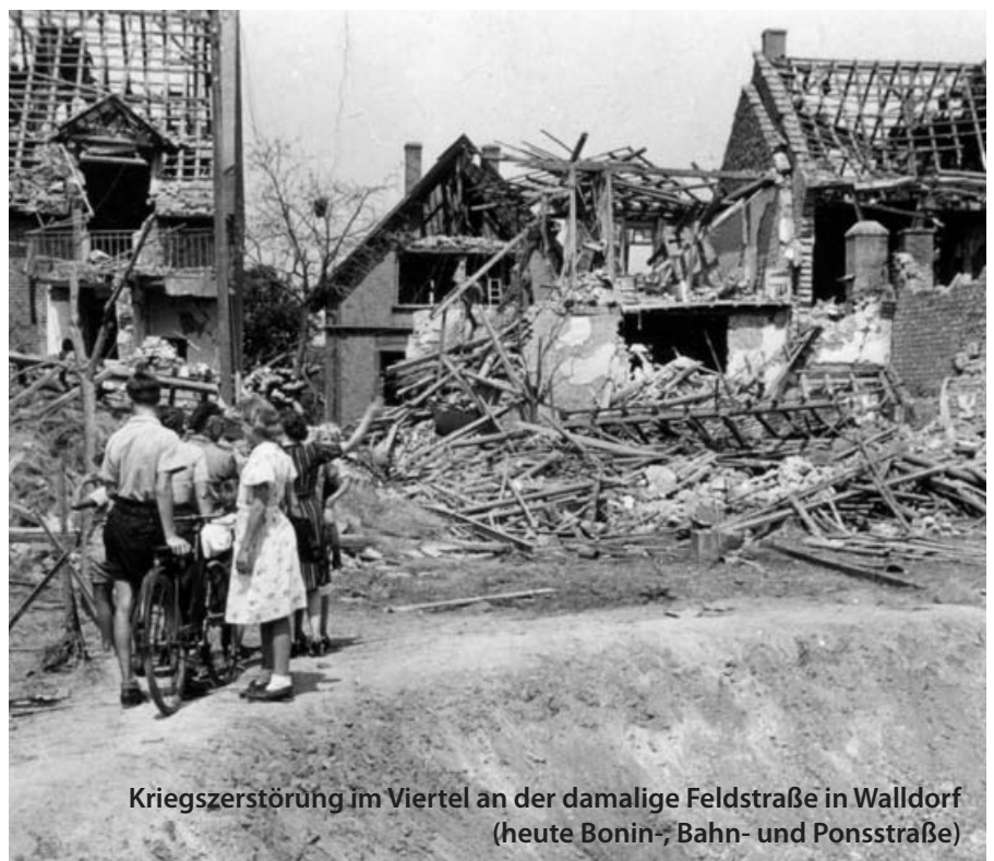
Kriegszerstörung im Viertel an der damalige Feldstraße in Walldorf (heute Bonin-, Bahn- und Ponsstraße)

Richard von Weizsäcker am 8. Mai 1985 im Deutschen Bundestag