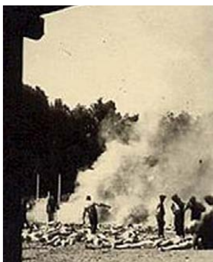
Leichenverbrennung durch das Sonderkommando KZ Auschwitz-Birkenau, fotografiert von Alberto Errera, August 1944. Durch Die „Ungarn-Aktion“ kamen die Gaskammern und Krematorien an ihre Grenzen. Tausende wurden im Freien verbrannt.

Am 27. Januar 1945 befreite die von Osten vorrückende Rote Armee das Vernichtungslager Auschwitz und fand dort ein Bild des Grauens vor. In Auschwitz fand mit dem Holocaust (der Shoah) ein systematischer und fabrikmäßiger Mord an europäischen Juden statt. Aber auch andere durch das NS-Regime verfolgte Gruppen wurden dort eingesperrt