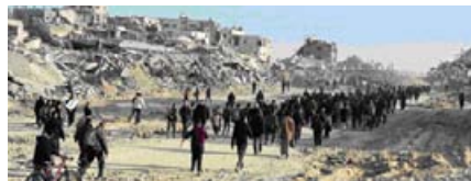
Palästinenser kehren in das völlig zerstörte Nord-Gaza zurück

Die Tatsache, die in der Debatte über Antisemitismus im Vereinigten Königreich oft ignoriert wird, ist die, dass viele Juden im Vereinigten Königreich und in ganz Europa die Politik Israels ablehnen und den Anspruch dieses Staates, sie zu vertreten, entschieden ablehnen. Wir halten die Anschuldigungen, Kritik an der israelischen Politik sei eine Form von Antisemitismus, für den Versuch, Juden in ein einziges politisches Klischee zu zwingen und zu behaupten, dass britische Juden dem Staat Israel gegenüber loyaler seien als ihrem Heimatland. Das sind an sich schon rassistische, antijüdische Voreingenommenheiten. Als Mitglieder jüdischer Vereinigungen in ganz Europa lehnen wir die koloniale und rassistische Verfolgung des palästinensischen Volkes durch den Staat Israel entschieden ab, eine Verfolgung, die seit der Gründung dieses Staates und sogar schon vor ihr vielfältige Formen angenommen hat. Seit dem