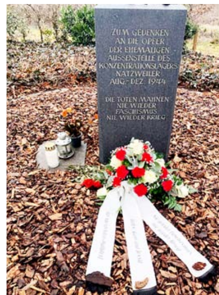
Der 1981 gegen viele Widerstände gesetzte Gedenkstein mit einem Blumengebinde der Lagererentdecker