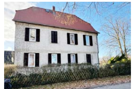
Altes Forsthaus am Gundhof - Unter Ausschluss der Öffentlichkeit verkauft

LL-Fraktion wird zu diesem Grundstücksverkauf die Einsetzung eines Akteneinsichtsausschusses verlangen.