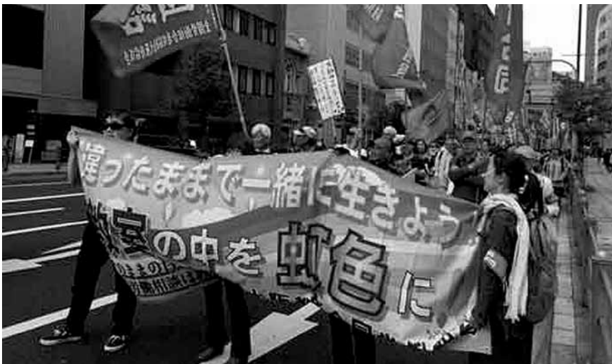
1. Mai-Demo: Die Gewerkschaft der Lehrer in Osaka (Osaka Education Joint Labor Union). Auf dem Transparent: Auch wenn wir alle verschieden sind - lasst uns zusammen leben.

Behalten wir jetzt allerdings im Hinterkopf, dass es weder eine geregelte 5-Tage-Woche, noch den 8-Stundentag gibt und sehen uns die Zahl der prekären Arbeitsverhältnisse an (2016: 20% bei Männern, 55% bei Frauen), so erscheint es logisch, dass kaum jemand in Japan die Urlaubstage ausschöpft. Im Gegenteil; der Druck durch Vorgesetzte und die Angst, den Arbeitsvertrag nicht verlängert zu bekommen, treibt die Menschen bis zum Äußersten. Sind die Forderungen der japanischen Arbeitnehmer*innen also gerechtfertigt? Allemaal. Vielmehr gehen sie gar nicht weit genug. Ist das ein Vergleich zwischen Äpfeln und Birnen? Wir sagen: Nein. Die aufgeführten Verhältnisse in Japan können schnell auch bei uns Alltag werden, wenn wir nicht jedes Gesetz zum Schutz der Arbeitnehmer*innen verteidigen und uns gegen den ständigen „Optimierungszwang“ wehren.