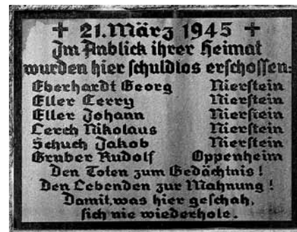
Die Gedenktafel am Kornsand.

Die diesjährige findet statt am Mittwoch, 21. März, um 18 Uhr.