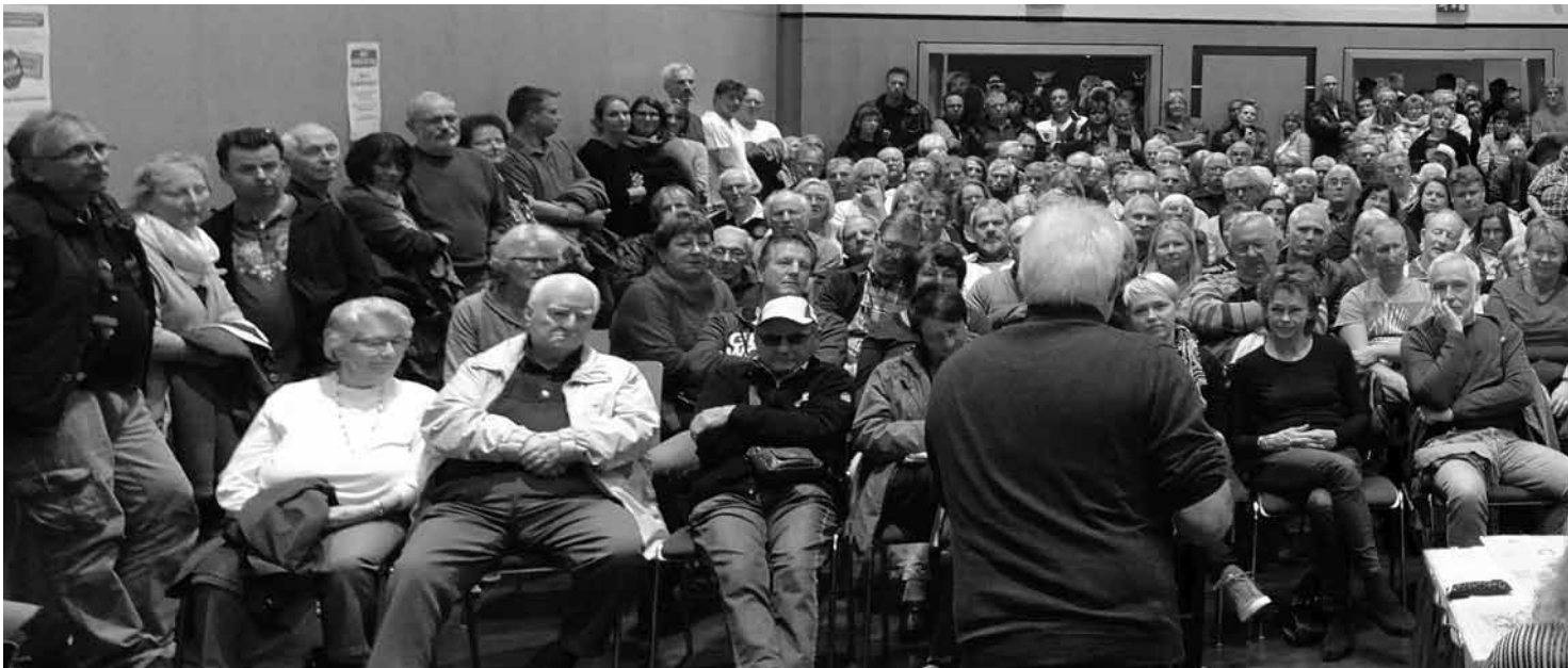
Der Widerstand wird stärker. Eine Versammlung gegen die Straßenbeiträge im Bürgerhaus mit Diskussionen, in denen die Ablehnung dieser Pläne deutlich ausgesprochen wird. Wir empfehlen